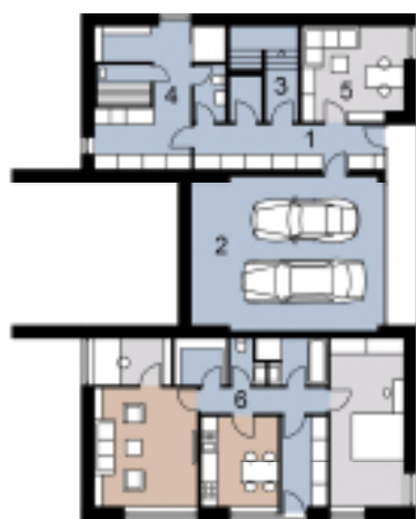
Půdorys 1. podlaží

Stempel & Tesař architekti tel.: 777 081 580 www.stempel-tesar.com