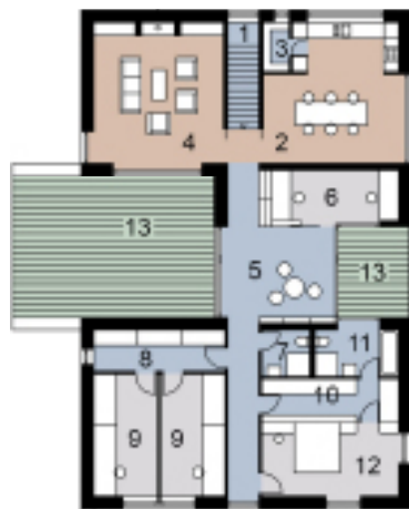
Půdorys 2. podlaží

1 – vstup, 2 – garáž, 3 – šatna, 4 – sauna s koupelnou, 5 – pokoj pro hosty, pracovna, 6 – samostatný byt pro maminku