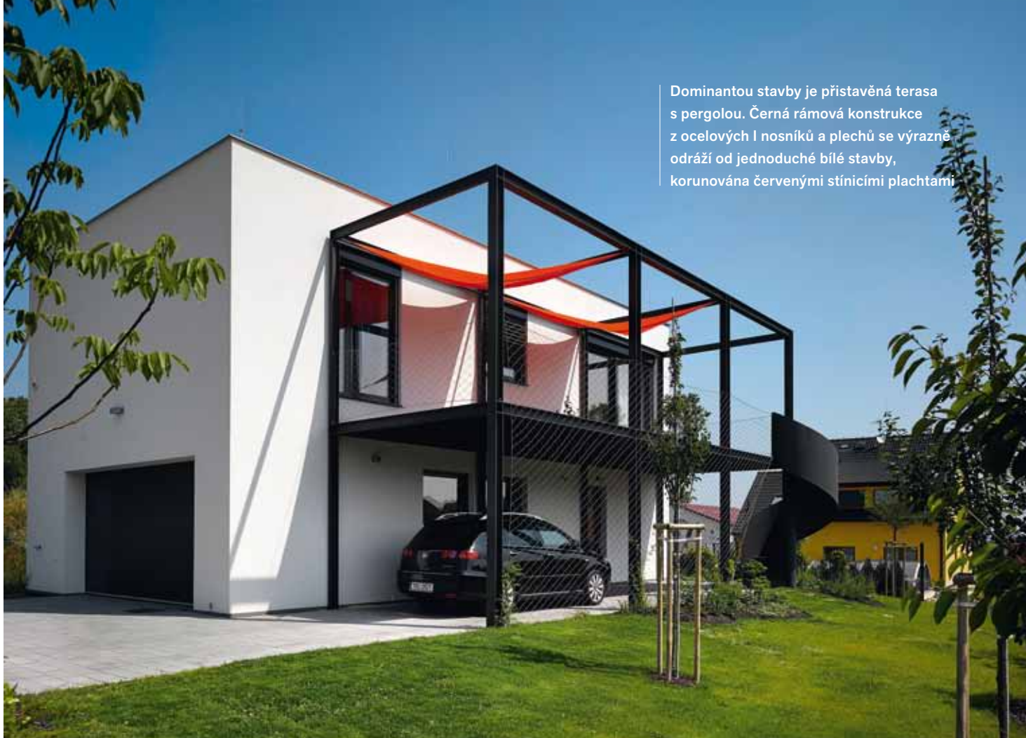
Dominantou stavby je přistavěná terasa s pergolou. Černá rámová konstrukce z ocelových I nosníků a plechů se výrazně odráží od jednoduché bílé stavby, korunována červenými stínícími plachtami

Z ákladním a určujícím prvkem celé stavby nebyla ani kuchyně, obývací či tělocvična, ale garáž. Priority většiny investorů tkví obvykle jinde.