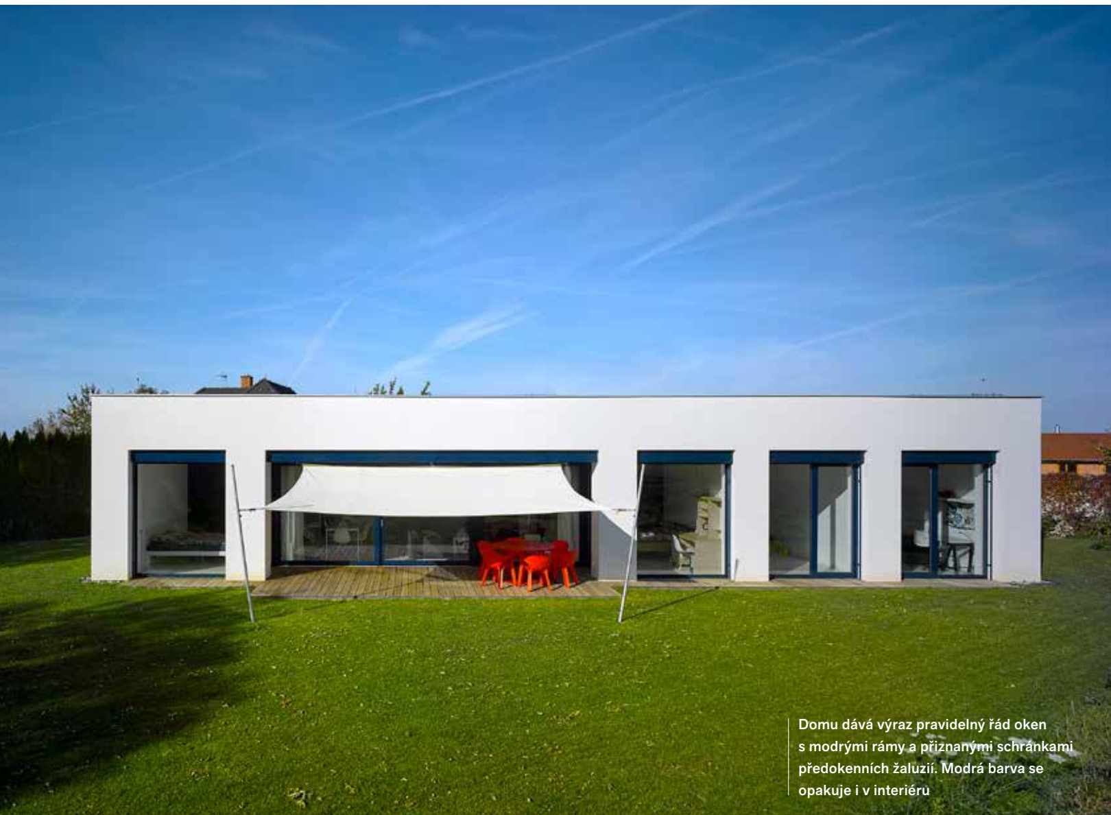
Domu dává výraz pravidelný řád oken s modrými rámy a příznanými schránkami předokenních žaluzií. Modrá barva se opakuje i v interiéru

R odina se dvěma dětmi předškolního a školního věku si přála jednoduché, účelné a úsporné bezbariérové bydlení s moderním designem, které si nevyžádá příliš velké investice ani velké provozní náklady. Obrátili se na architektonickou kancelář Stempel & Tesar architekti, která má s tímto typem staveb bohaté zkušenosti.