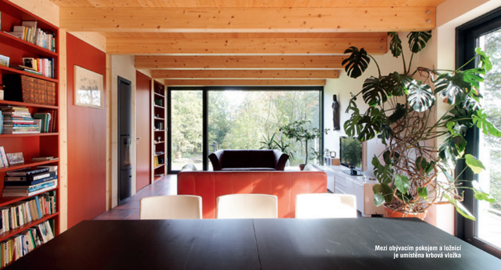
Mezi obývacím pokojem a ložnicí je umístěna křbová vložka