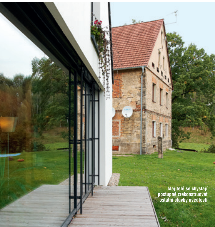
Majitelé se chystají postupně zrekonstruovat ostatní stavby usedlosti

koutem. Ten je také přístupný přes spíž ze zádveří. Dvoje dveře spíže sice zmenšují skladovací prostor, ale tato malá nevýhoda je vyvážena možností uložit nákup hned po vstupu a nenosit ho přes půl domu. K ložnici majitelů náleží vlastní koupelna s vanou. Druhá koupelna je v patře, kde se dále nachází čtyři pokoje. Původní stáj byla částečně podsklepená, při stavbě došlo ke zpevnění suterénu a základů železobetonovou stěnou. Opravený původní sklep dále slouží svému účelu.