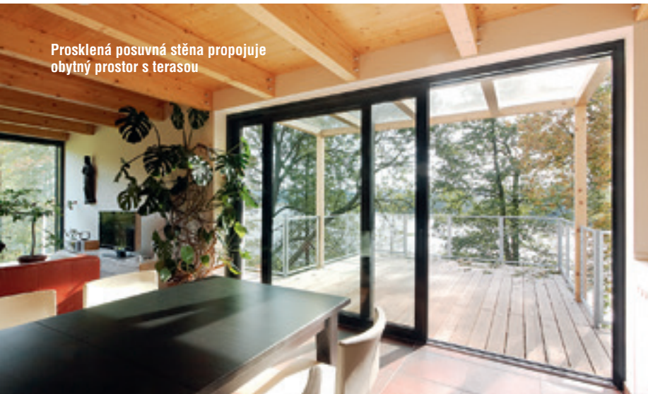
Prosklená posuvná stěna propojuje obytný prostor s terasou