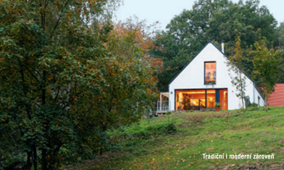
Tradiční i moderní zároveň