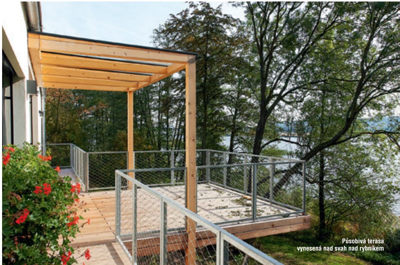
Působivá terasa vynesená nad svah nad rybníkem