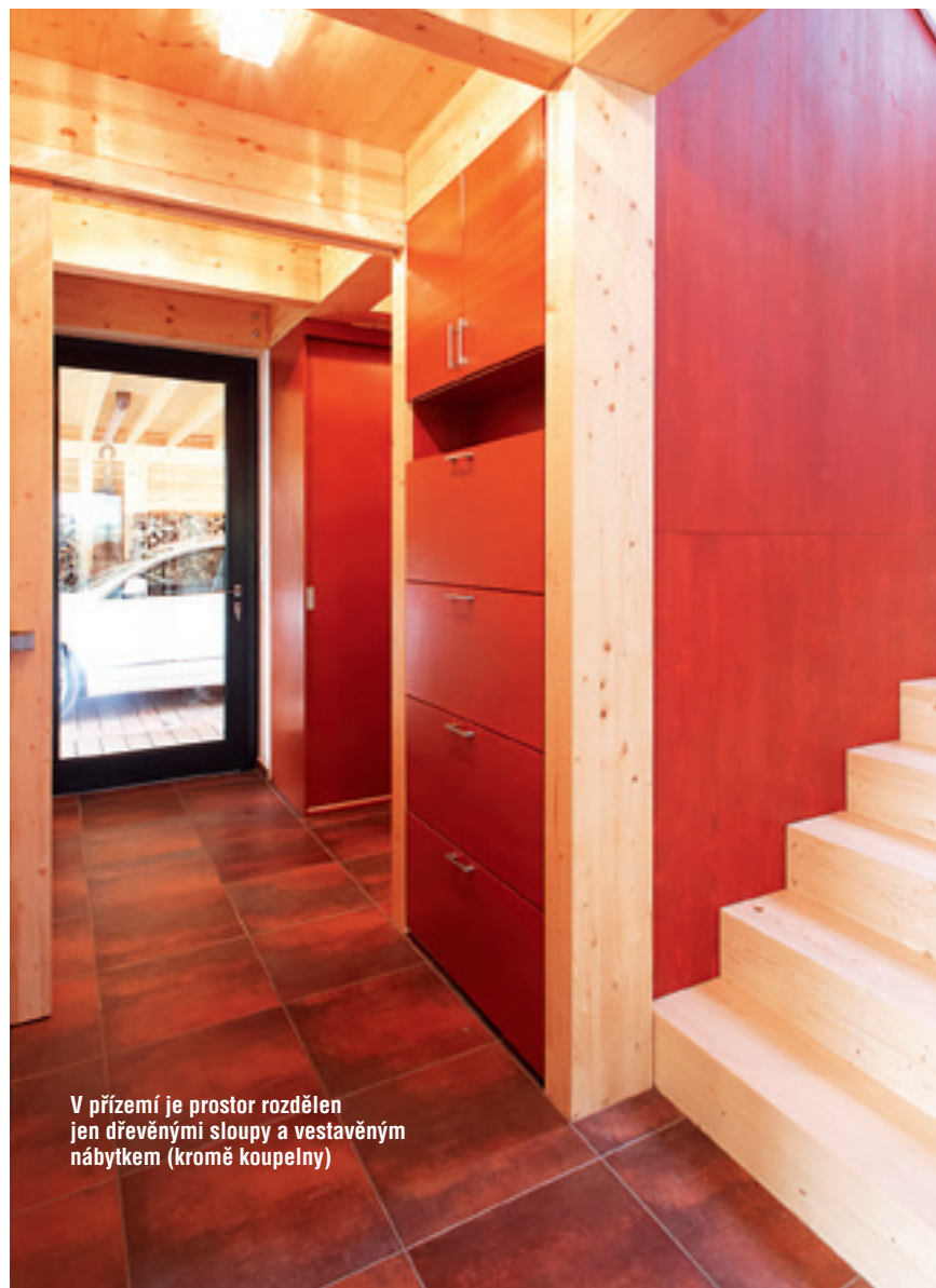
V přízemí je prostor rozdělen jen dřevěnými sloupy a vestavěným nábytkem (kromě koupelny)