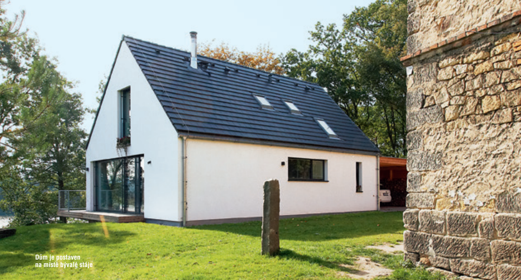
Dům je postaven na místě bývalé stáje