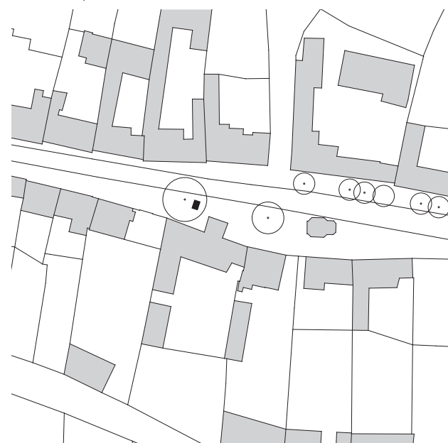
Situace Site plan

Construction and technology 15 mm solid metal sheet construction / perforation panel construction carefully sample tested